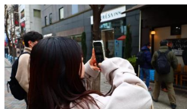
▲学生が取材するようす