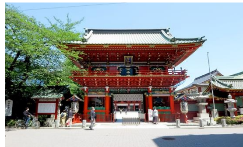
神田神社（神田明神）