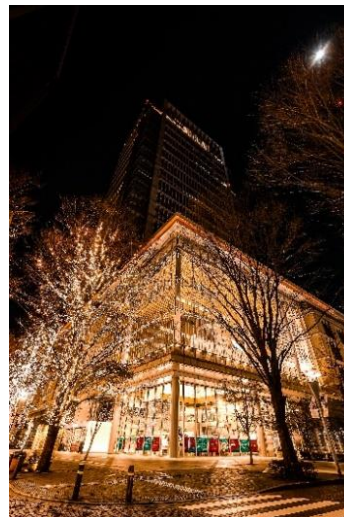
▲「丸の内イルミネーション」昨年開催時の様子

場 所： 東京駅前周辺及び丸の内仲通り 期 間： 2023年11月16日（木）～2024年2月18日（日） 95日間（予定） 点灯時間： 16:00～23:00 ※12月1日（金）～31日（日）は16:00～24:00（予定） ※一部エリアにより異なる場合あり W E B： https://www.marunouchi.com/event/detail/37086/