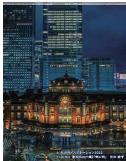
『CENTRAL TOKYO ILLUMINATION ガイド 2023』イメージ