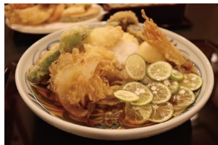
「手打ちそば 膳」すだち鰻天そば