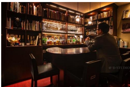
「ブックバー リリパット」店内