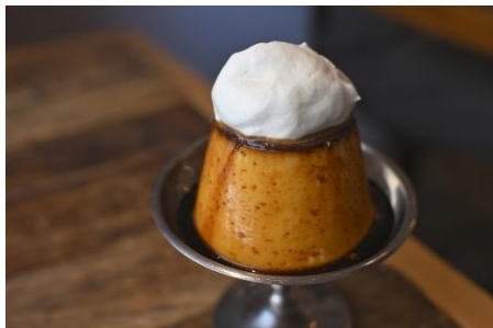
「iijikan」クラシックプリン