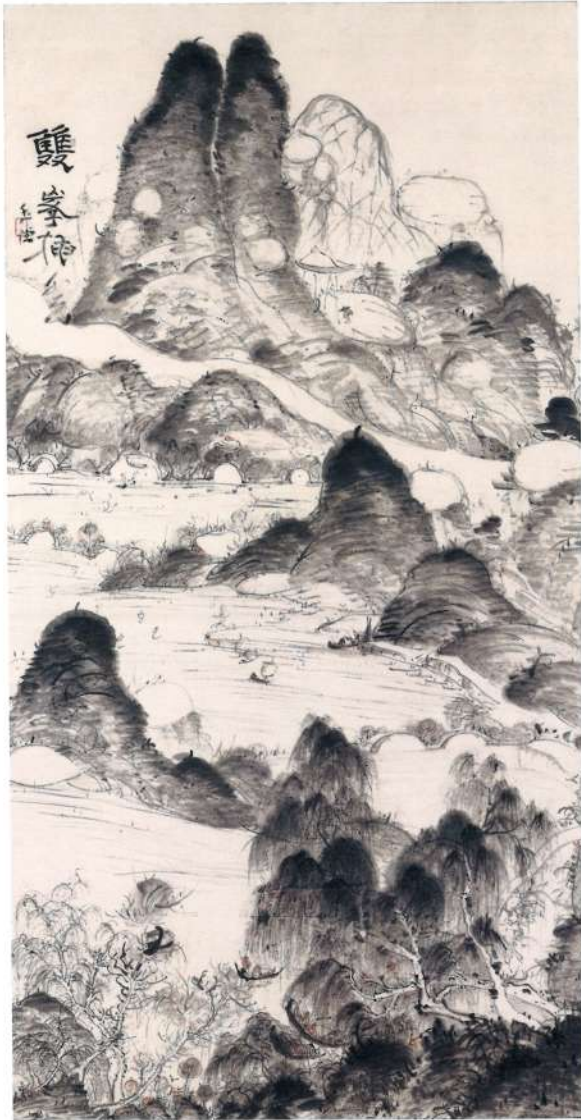
雙峯挿雲圖 浦上玉堂 江戸時代 重要文化財 出光美術館蔵

北宋時代(960-1127)後期、画家・宋迪は湖南省の名勝・瀟湘地方が見せる折々の風光を、情趣豊かな八つの情景に描きました。瀟湘八景と呼ばれるこの画題は、後に山水画の好画題として画家たちの発想の源となっただけでなく、日本でも大いなる憧れをもって受け入れられました。本展ではこの瀟湘八景を出発点に、西湖など中国・日本で古くから描き継がれた情景を通じて、人々が心に抱いた憧れの山水の世界をご堪能いただけます。