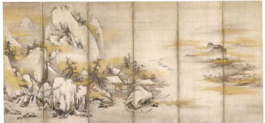
瀟湘八景図屏風(左隻) 伝 周文 室町時代 重要文化財 香雪美術館蔵