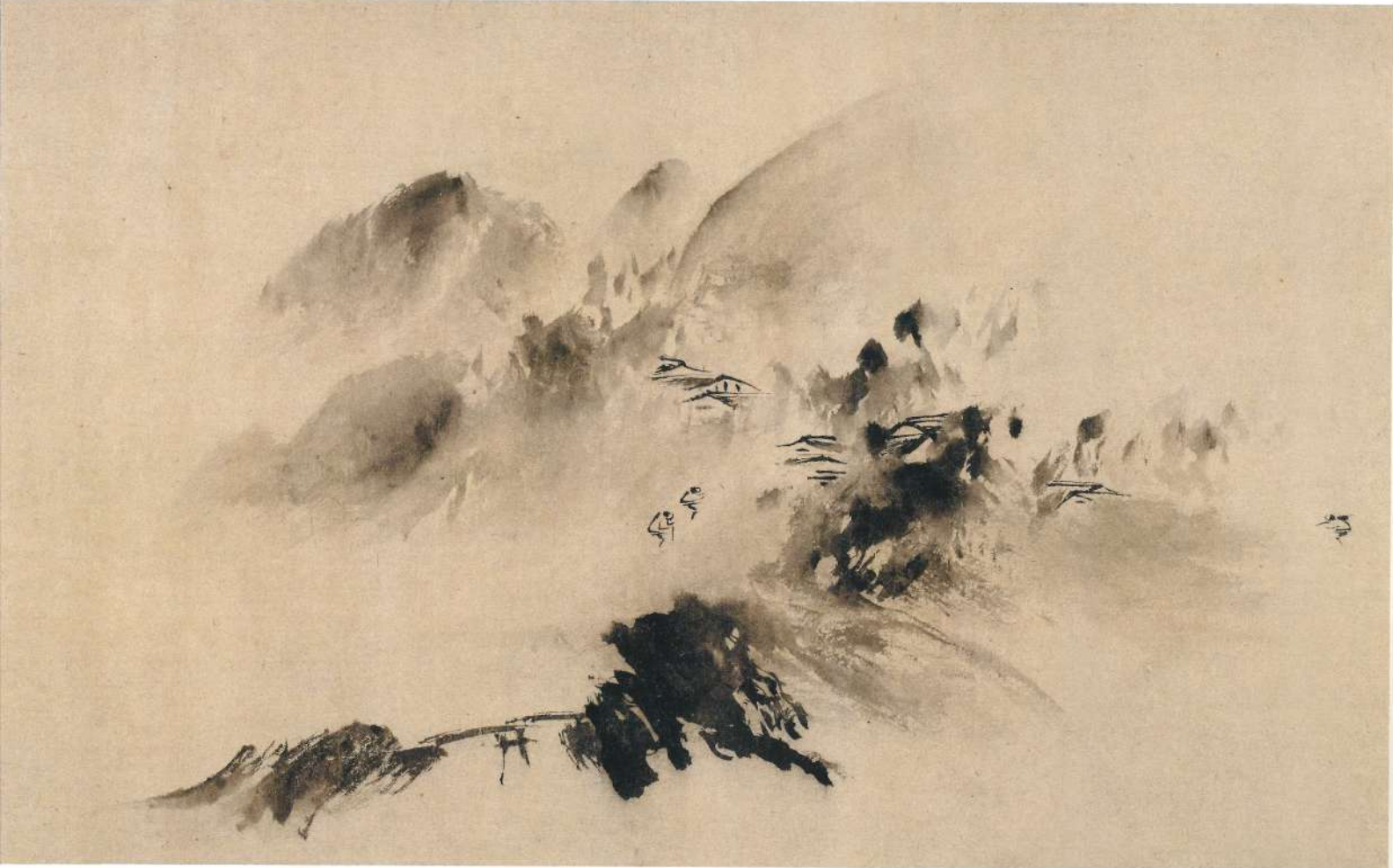
山市晴嵐図(部分) 玉潤 中国 南宋時代末期～元時代初期 重要文化財 出光美術館蔵