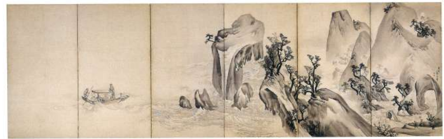
赤壁図屏風(右隻) 長澤芦雪 江戸時代 重要美術品 根津美術館蔵