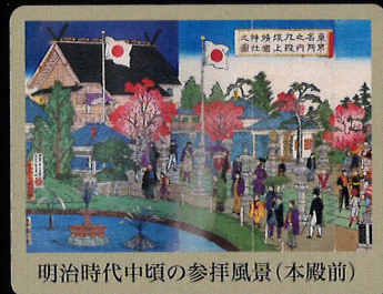
明治時代中頃の参拝風景(本殿前)

特別中庭参拝をした方に参拝記念品「月餅」を進呈。高、小学生以下のお子様には露店で使える「おたのしみ券」を進呈。