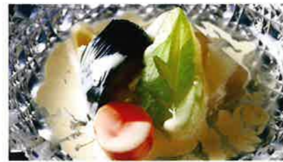
冷やし揚げ茄子、花けずり浸し 800円(税込)