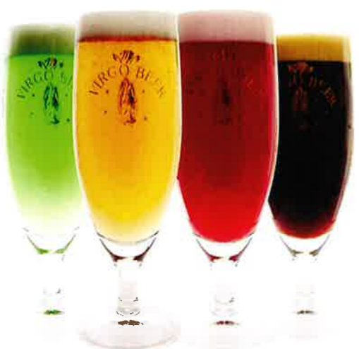
ブルーライチビール (左) ラガービール (中央左) ピンクハチミツレモンビール (中央右) 黒ビール (右) 各500円(税込)