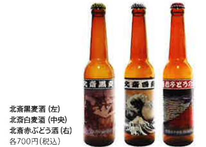
北斎黒麦酒 (左) 北斎白麦酒 (中央) 北斎赤ぶどう酒 (右) 各700円(税込)