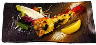
伊勢海老夏草クリーム焼き 2,800円(税込)

※写真はイメージです。※メニューについては事前に告知なく変更する場合があります。 ※器についてはイベントでは別のものを使用します。