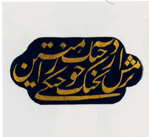
藍釉金彩文字文タイル イラン 17世紀