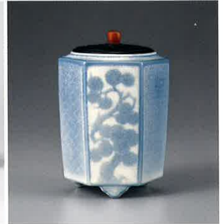
彩磁六方香爐 日本 板谷波山 昭和時代前期