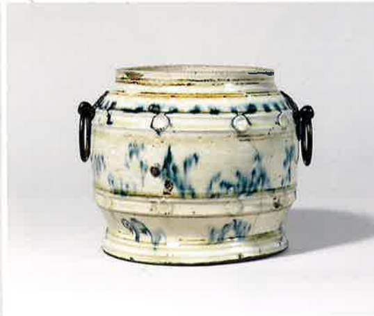
青花貼花文壺(手焙) ベトナム 16-17世紀