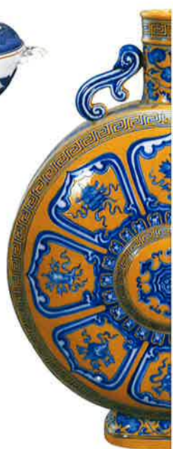
黄釉藍彩吉祥文扁壺 フランス セーブル窯 18世紀