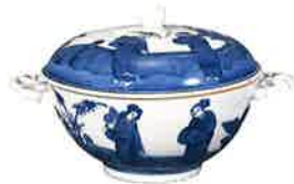
奥付人物文蓋物 日本 肥前窯 江戸時代中期