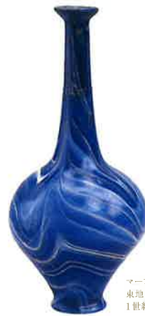
マーブル笑筒瓶 東地中海地域 1世紀