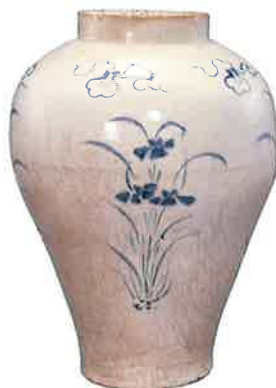
青花秋草文壺 朝鮮 朝鮮王朝時代