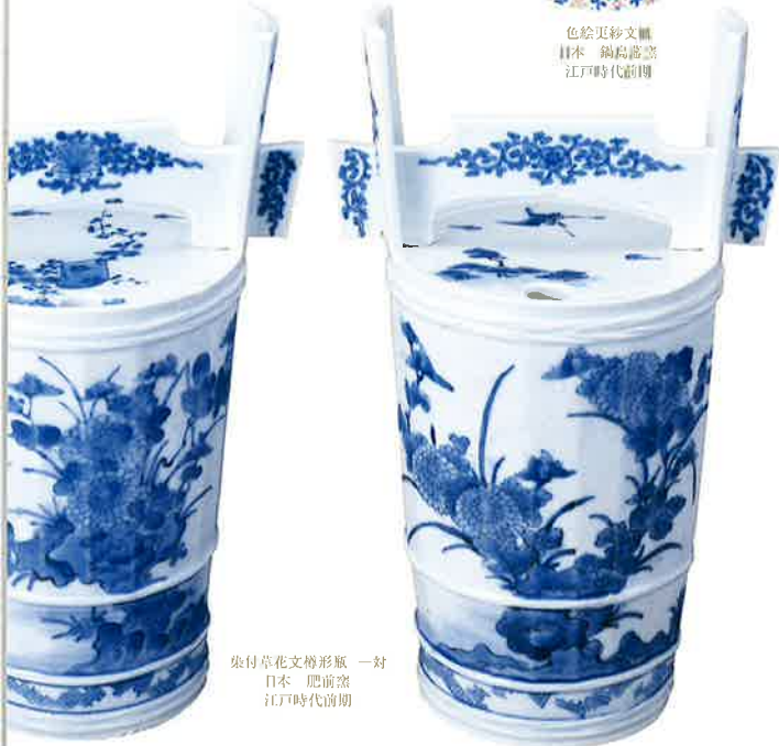
奥付草花文樽形瓶 一對 日本 肥前窯 江戸時代前期