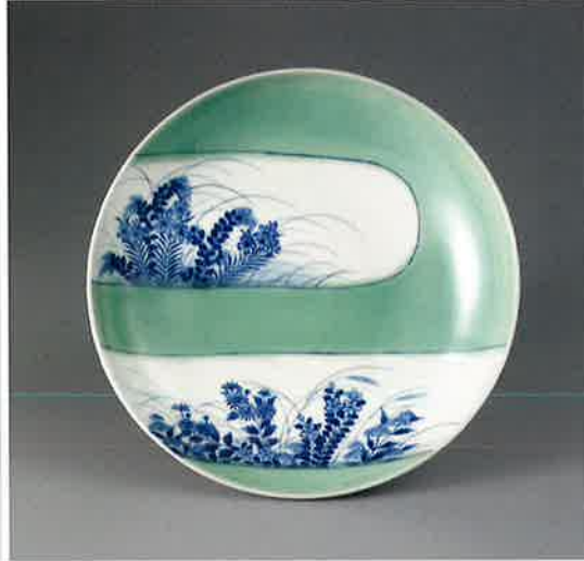
青磁染付秋草文皿 日本 鍋島藩窯 江戸時代中期