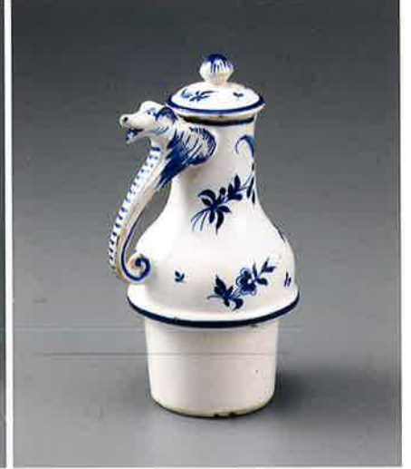
白地藍彩犬形把手付水注 オランダ デルフト窯 18世紀