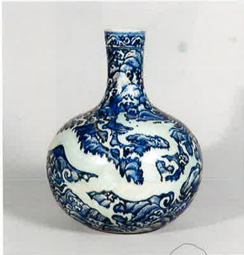
青花龍濤文天球瓶 中国 景德鎮官窯 明・永楽時代