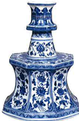
青花牡丹唐草文八角燭台 中国 景德鎮官窯 明・永楽時代