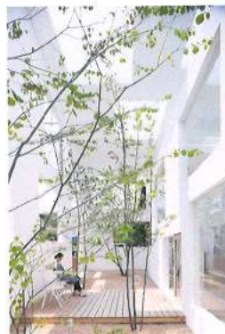
1 パウル・クレー《花ひらく木をめぐる抽象》1925年、東京国立近代美術館 2 ズビグニエフ・リプチンスキ《タンゴ》1980年、ズビグ・ビジョン ©Zbig Vision 3 ヴォルフガング・ティルマンス《tree filling window》2002年、ワコウ・ワークス・オブ・アート 4 ローマン・シグネール《ウィンドウ・シャッター》2012年 ©Roman Signer Photo: Michael Bodenmann 5 ゲルハルト・リヒター《8枚のガラス板》2012年、ワコウ・ワークス・オブ・アート ©Gerhard Richter, courtesy of WAKO WORKS OF ART Photo: Tomoki Imai 6 [参考] 藤本壮介《House N》2008年 Photo: Iwan Baan

一般 1,200(900)円、大学生 700(500)円 無料観覧日 | 11月3日[日・祝]文化の日