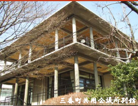
三番町共用会議所別館