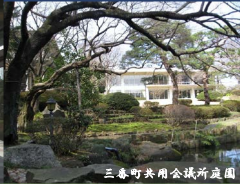
三番町共用会議所庭園