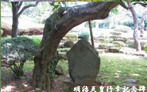
明治天皇行幸記念碑