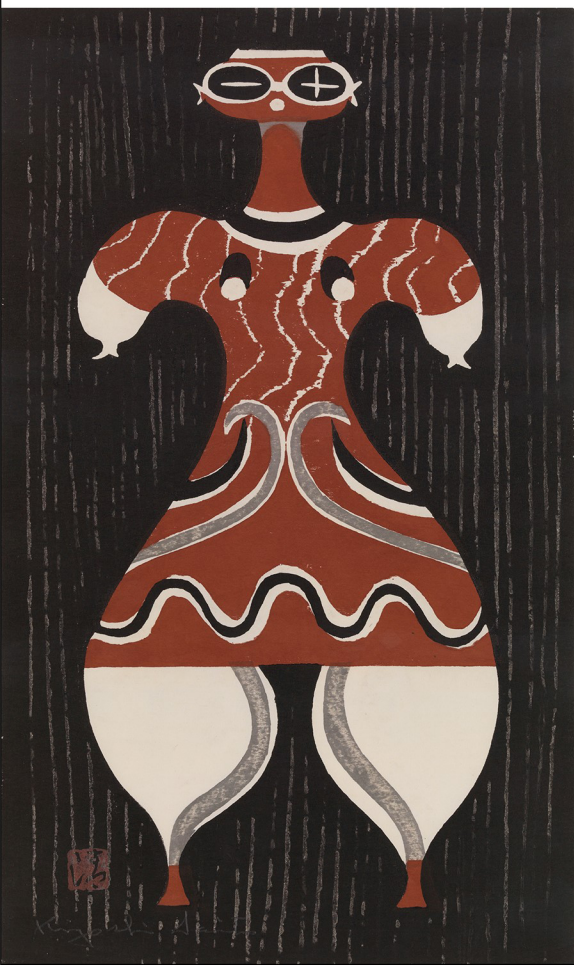
原田清「ハニワ」1958年、ギャラリー町立新橋美術館