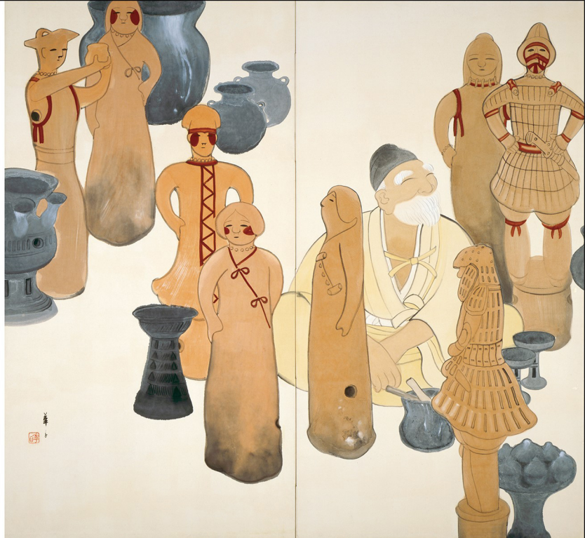
東京国立近代美術館 常設展示「現代の土偶」展 1996年