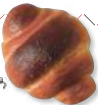
白トリュフの塩パン