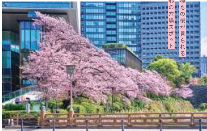
何種もの桜が見られる 都心の穴場スポット

📍千代田区富士見2-10-2 飯田橋グラン・ブルームサクラテラス 🚉 JR 地下鉄 飯田橋駅 MAP A-1⑪