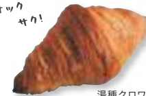
湯種クロワッサン

何度も来店しているパン野さんの推しパン。口どけがいい生地に、じゅんわりあふれるバターが背徳の味♡