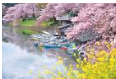
東京大回廊写真コンテスト入選作品「春爛漫」Chong Joon Keong

千鳥ヶ淵ではお濠の水上から桜を眺めることもできる。満開の桜の下、ボートで過ごす時間はこの上なく贅沢な時間だ。「千代田のさくらまつり」期間中は夜間も営業。ライトアップされた桜と水面に映る桜、幻想的な風景を堪能したい。