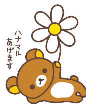
ハナマル あげます

📍千代田区皇居外苑2 🚉 JR 東京駅、有楽町駅 地下鉄 二重橋前駅、大手町駅、東京駅、有楽町駅、日比谷駅 MAP B-2⑯