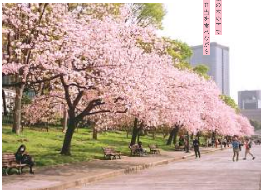
桜の木の下で お弁当を食べながら