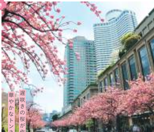
遅咲きの桜が作る 華やかなトンネル

📍千代田区紀尾井町2 🚉 地下鉄 赤坂見附駅、永田町駅、麴町駅 MAP A-2⑭