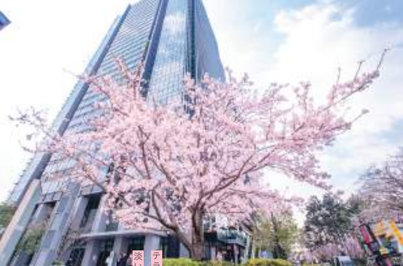
淡いピンクの世界 テラス席から眺める