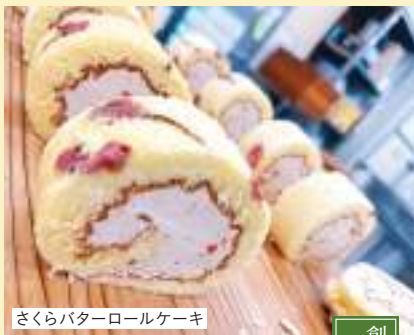
さくらバターロールケーキ

📍千代田区神田淡路町2-4 🚇JR 御茶ノ水駅、秋葉原駅 地下鉄 小川町駅、淡路町駅 MAP B-1㉒