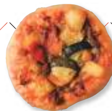
たっぷり野菜の スパイシーカレー