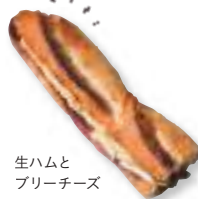
生ハムと ブリーチーズ