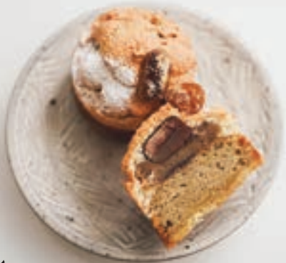
ベイクド モンブラン

クッキー&ダイヤモンド生地を土台に、たっぷりの栗クリーム、丸ごと入った栗の渋皮煮がたまらない焼きモンブラン。層ごとに違う生地も楽しめて◎