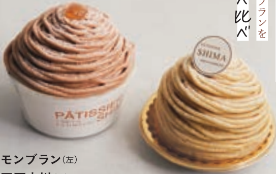
モンブラン(左) 四万十川(右)

フランス産の栗を使用した洋ver(左)と、四万十川の栗を使用した和ver(右)の2種類。それぞれの栗の味わいが楽しめる。