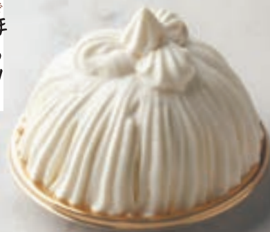
マロンシャンティイ

栗と生クリーム、ジェノワーズだけの洗練されたシンプルなモンブラン。裏ごししたほろほろの栗と、さっぱりした生クリームの組み合わせは絶品！