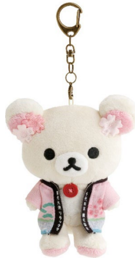
桜と黒松の入浴剤（左）と観光大使リラックマのおでかけぬいぐるみキーホルダー