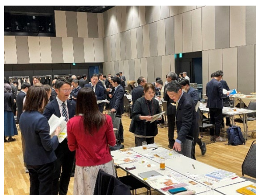
会員交流会の様子（会場：神田スクエア 大ホール）