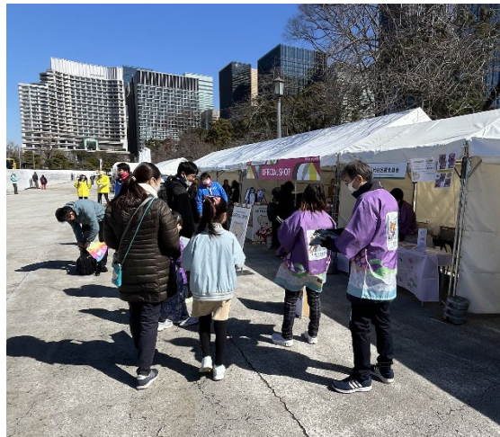
東京マラソンに出展(皇居外苑)