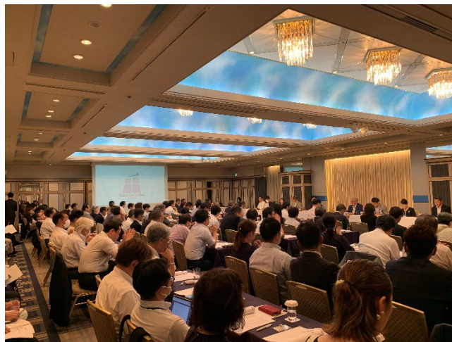
昨年の総会の様子（会場：ホテルニューオータニ）