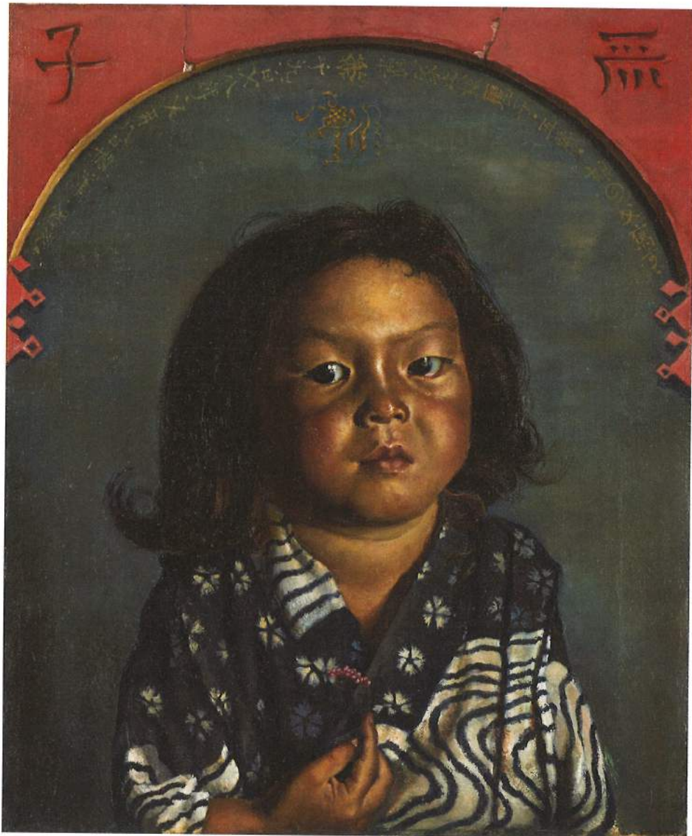
《麗子肖像(麗子五歳之像)》1918年10月8日 東京国立近代美術館 [通期展示]